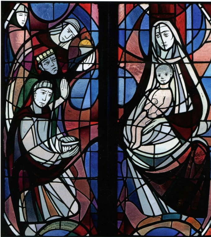
Peter Valentin Feuerstein: Die Geburt Jesu in der ev. Johannes-Täufer-Kirche Hornberg 1955, Christus-Fenster rechts im Chorraum