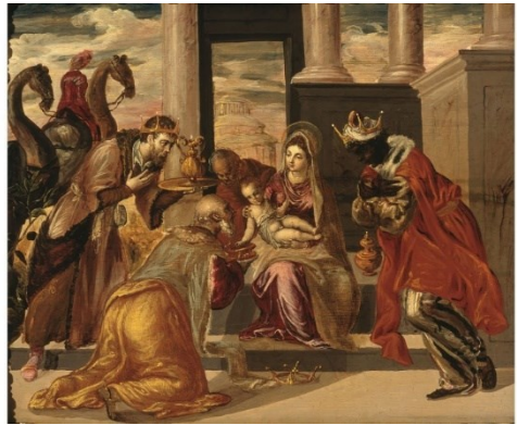
El Greco - Die Anbetung der Heiligen Drei Könige (Die Drei Weisen aus dem Morgenland)

Dem Stern folgen und im Stall landen. Das kann man als ernüchternd und enttäuschend erleben, oder aber, wie in der Heiligen Nacht, das kann auch der Durchbruch sein, Gott und das Leben zu verstehen: Aufschauen, nach den Sternen sehen, das Licht wahrnehmen zur Orientierung, und dann im kleinen, grauen Leben alltäglich, trivial, Schritt für Schritt, Tat für Tat das Notwendige tun.