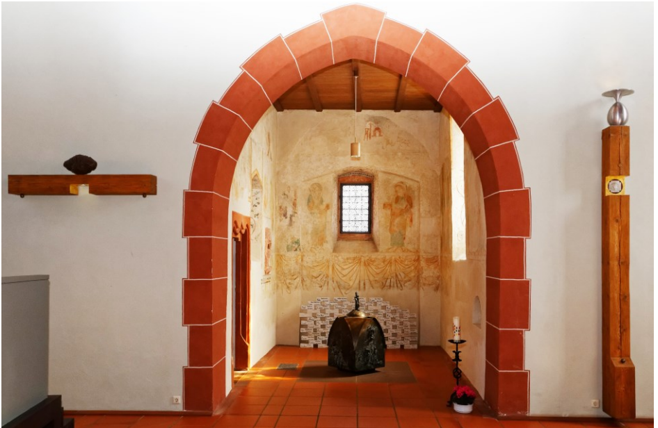
Vincentiuskirche Linx / Rheinau geteiltes Kreuz und Chorraum mit Taufkessel von Jürgen Goertz